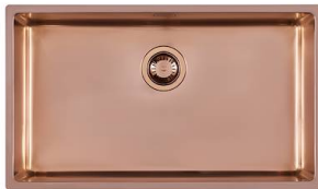
水槽 KE Copper